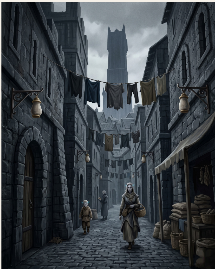
El Quinto Anillo al atardecer.