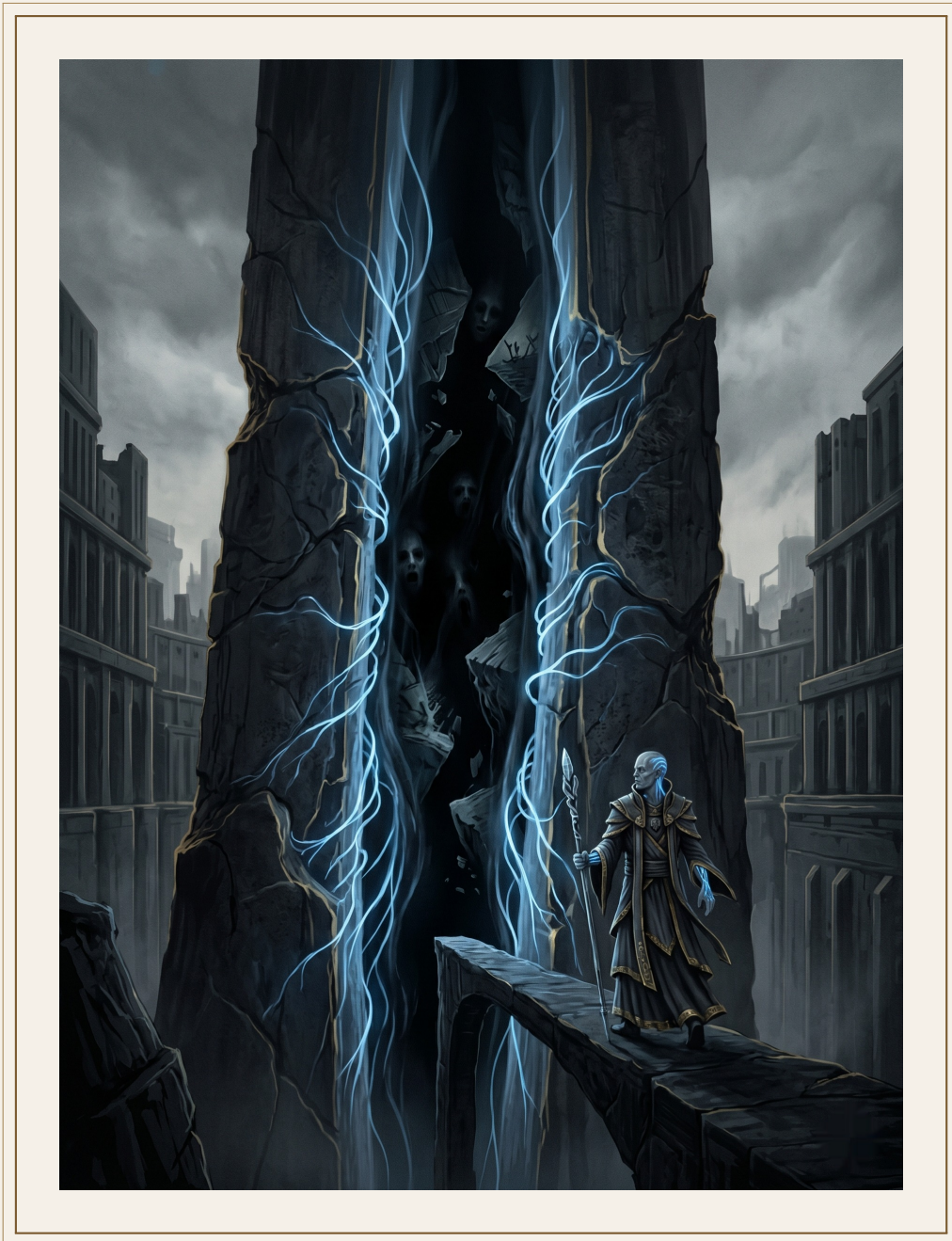
La Grieta Central — lo que vino después de Eryndor.

Eryndor era un mundo mediano. No rico, no poderoso, no especial de ninguna forma que importase a nadie hasta que importó a todos. Tenía un Nexo viejo, inestable, y lo peor de todo: estaba conectado a rutas de Umbral que los tres Credos usaban. Los Selladores querían protegerlo. Los Cosechadores necesitaban sus rutas para la Gran Cosecha — aquella operación de extracción masiva desde cinco mundos que salvó Umbralios. Y los Reescritores querían estudiar su Nexo porque era antiguo y se estaba rompiendo de una forma que no habían visto antes.