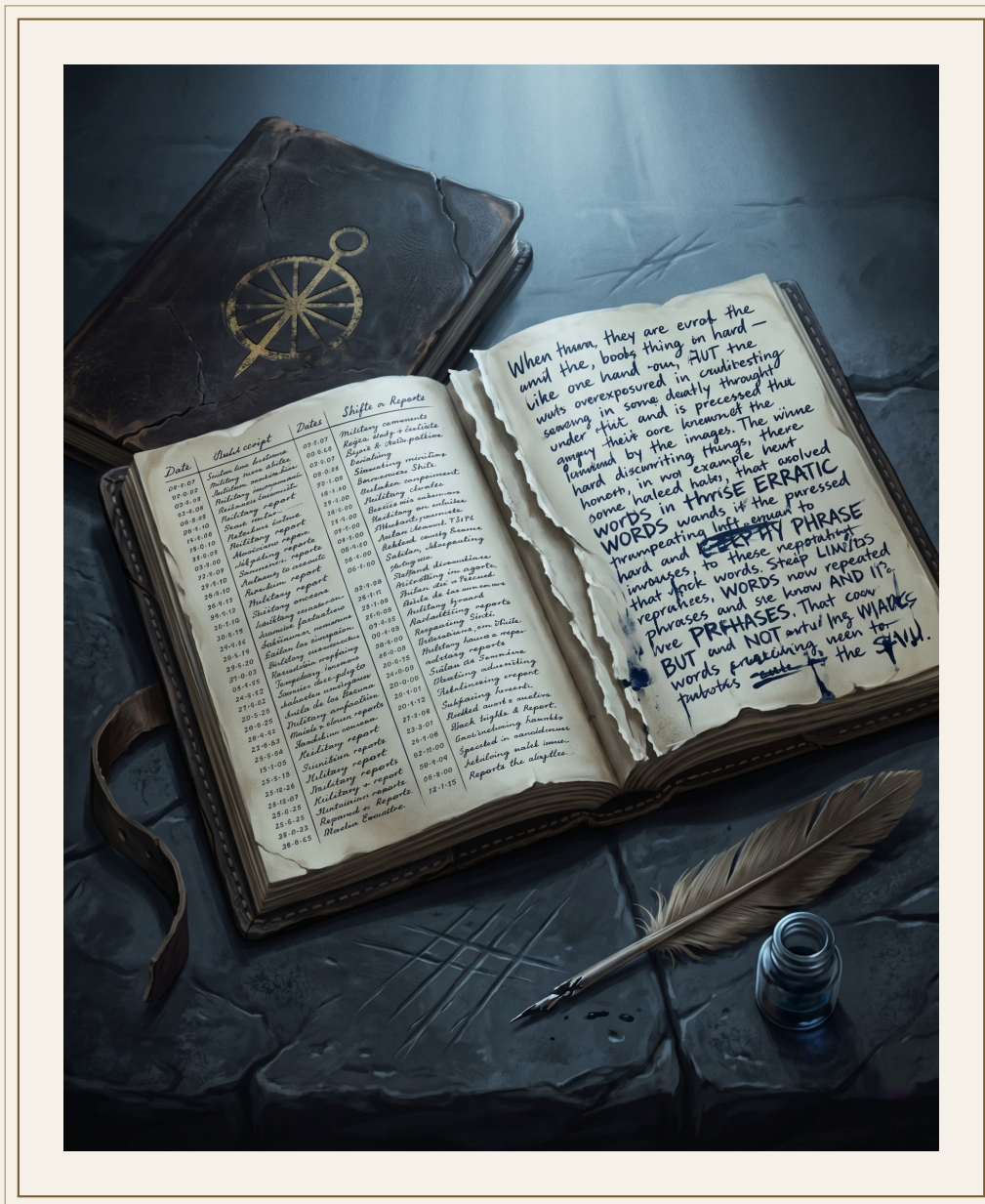
Cuaderno de Guardia 4.117 — página parcialmente tachada.

Hay cosas que llegan a las manos de una sin que nadie las envíe y sin que nadie pregunte cómo. En Ancorath funciona así: los secretos de la Orden no se roban. Se filtran. Se dejan sobre una mesa. Se olvidan en un cajón del Salón de Familias. Se pasan de mano en mano entre archivistas jubilados que ya no le deben nada a nadie.