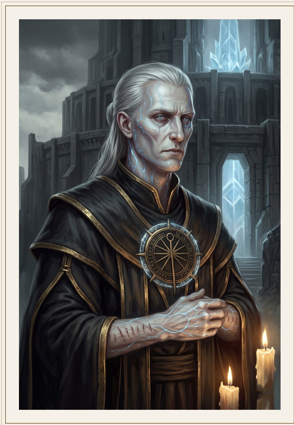
Varn, el Último Sello.

dentro del muro. Yo estoy fuera, mirando. La diferencia entre ella y yo es de tres kilómetros y una decisión que las dos tomamos y ninguna puede deshacer.