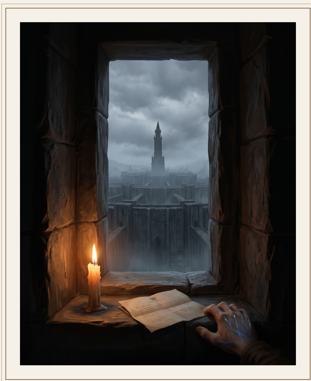
La torre del Primer Sello vista desde el Quinto Anillo.