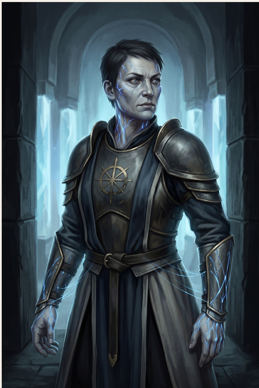
Lysara, Guardian of the First Seal.

El que quedó. El que salió. El que no se fusionó porque su cuerpo lo expulsó en el momento crítico.