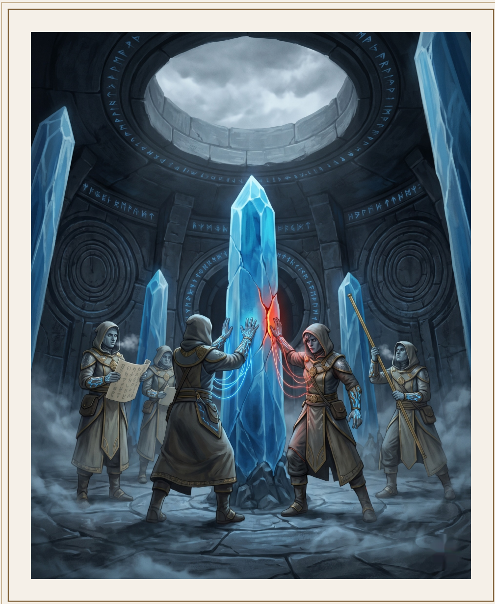
Cuadrilla de mantenimiento en el Corazón Sellado.

Los médicos de la Orden nos llaman Velados. Lo dicen como si fuera un nombre. Para nosotros no es un nombre. Es una condición.