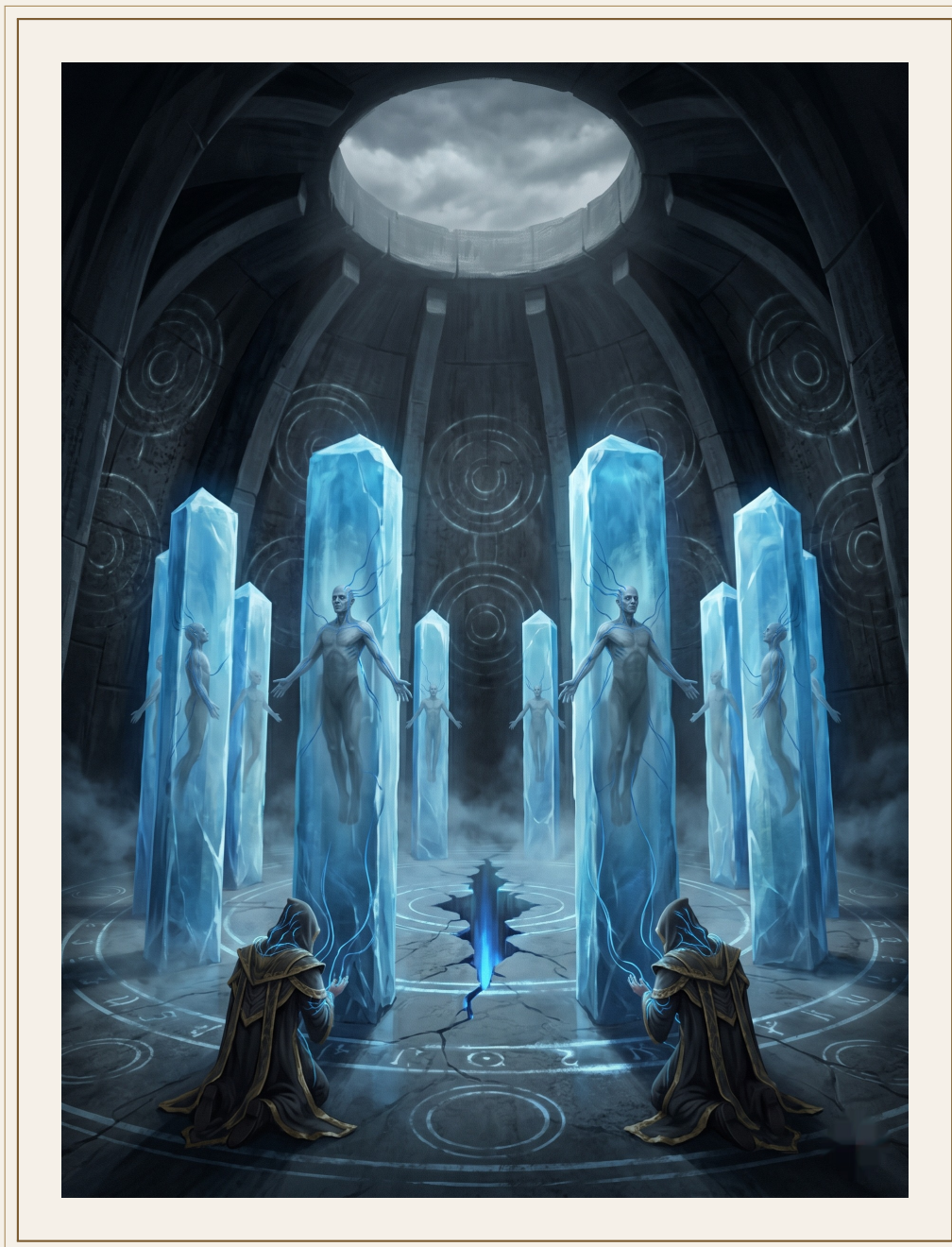
Interior del Anillo Primero — el Primer Sello.

Lo que más me cuesta del Sello no es la doctrina. No es el sacrificio. Es la elegancia con la que lo envuelven todo. El Juramento del Muro, el monumento a los mundos caídos, los discursos sobre el deber, la palabra “heroísmo” aplicada a personas que no duermen más de cuatro horas. Todo eso es verdad. Pero es una verdad con mucha práctica en sonar bien. Y cuando algo suena tan bien, me pregunto para quién está sonando.