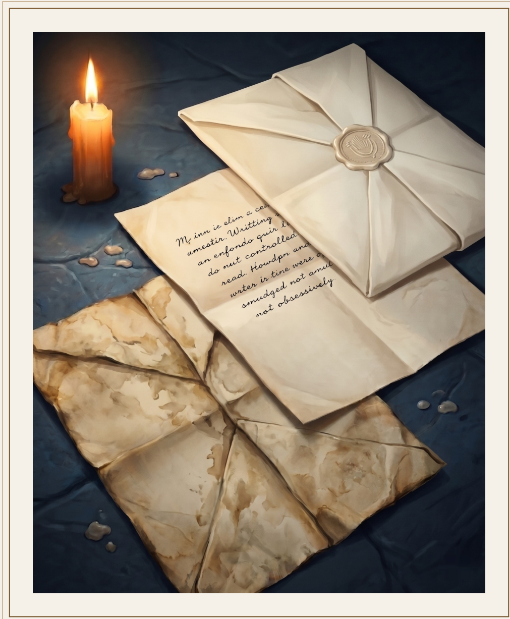
Las cartas de Mareen — nueve años de correspondencia.

El protocolo de correspondencia del Anexo D dice que los familiares de un Cedente pueden escribir una carta al mes. Que el Cedente puede responder cuando su horario lo permita. Que las cartas pasan por revisión de la Orden antes de ser entregadas en ambas direcciones.