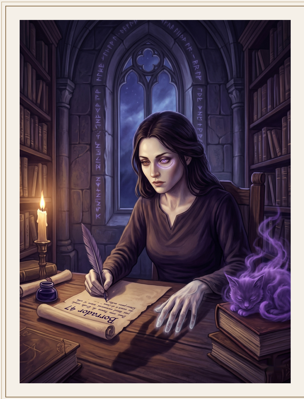
Veldrith escribiendo el Borrador 47.

cribio cuarenta y seis borradores de reconstrucción. Cada uno empezaba con hipótesis basadas en la estructura residual de la instrucción — el espacio que ocupaba, la posición relativa a las instrucciones adyacentes, los campos de metadatos que indicaban ámbito y función. Y cada uno se estrellaba contra el mismo muro: sin el contenido, cualquier reconstrucción era especulación. Especulación informada, rigurosa, brillantemente argumentada. Pero especulación.