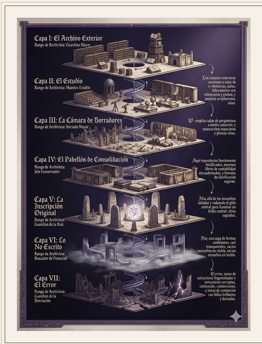
Mapa de Nexivara — las Siete Capas.