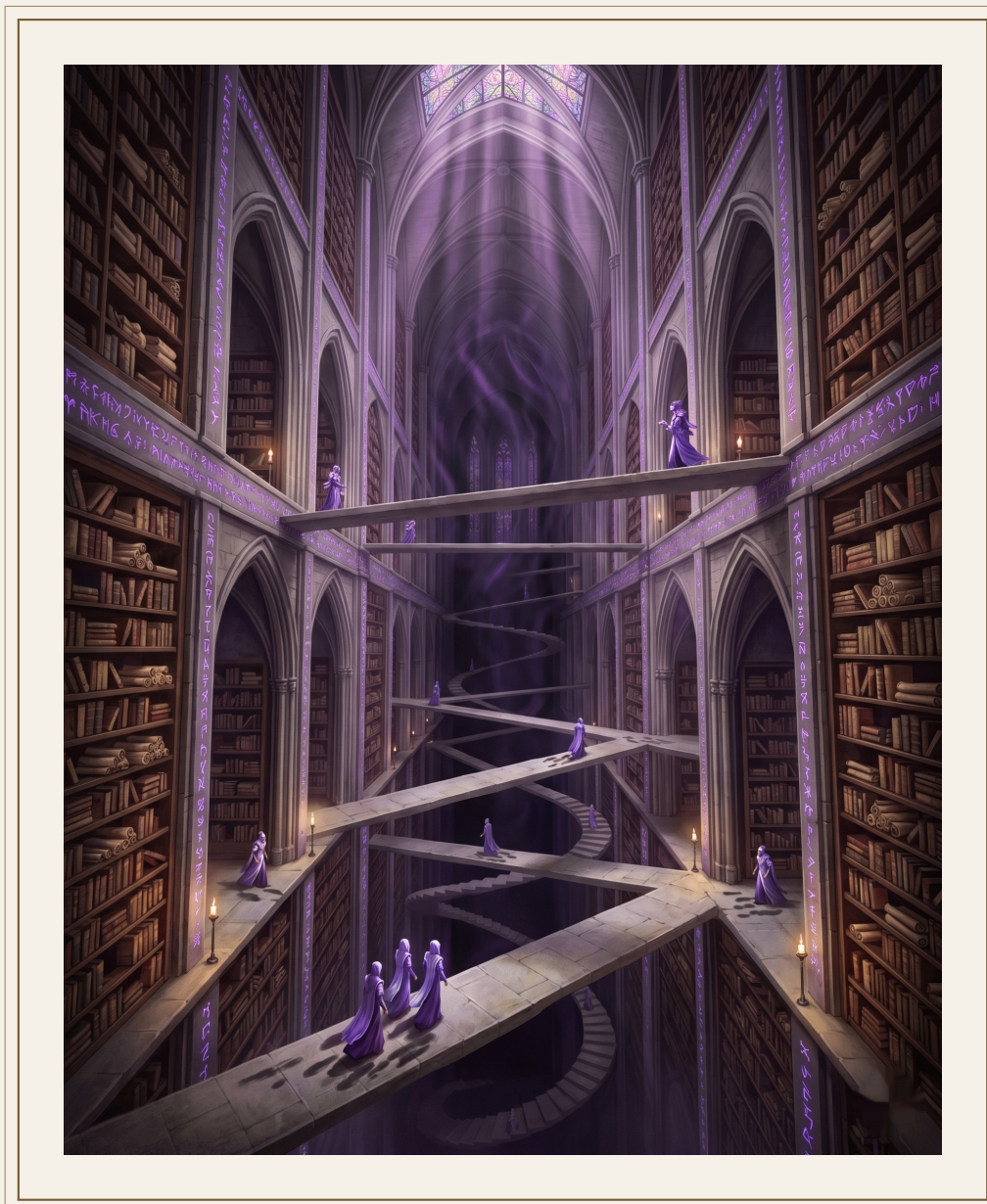
El Archivo Interior — Biblioteca del Antes.

Velo no degradado es de 4,7 unidades por ciclo” y “la velocidad máxima es de 6,2 unidades por ciclo”. Dice una cosa. Una sola. Y yo la leo, la verifico y la archivo.