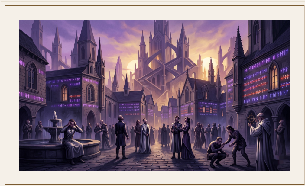
El Ajuste de Nexivara.

Nexivara no se parece a si misma dos veces seguidas.