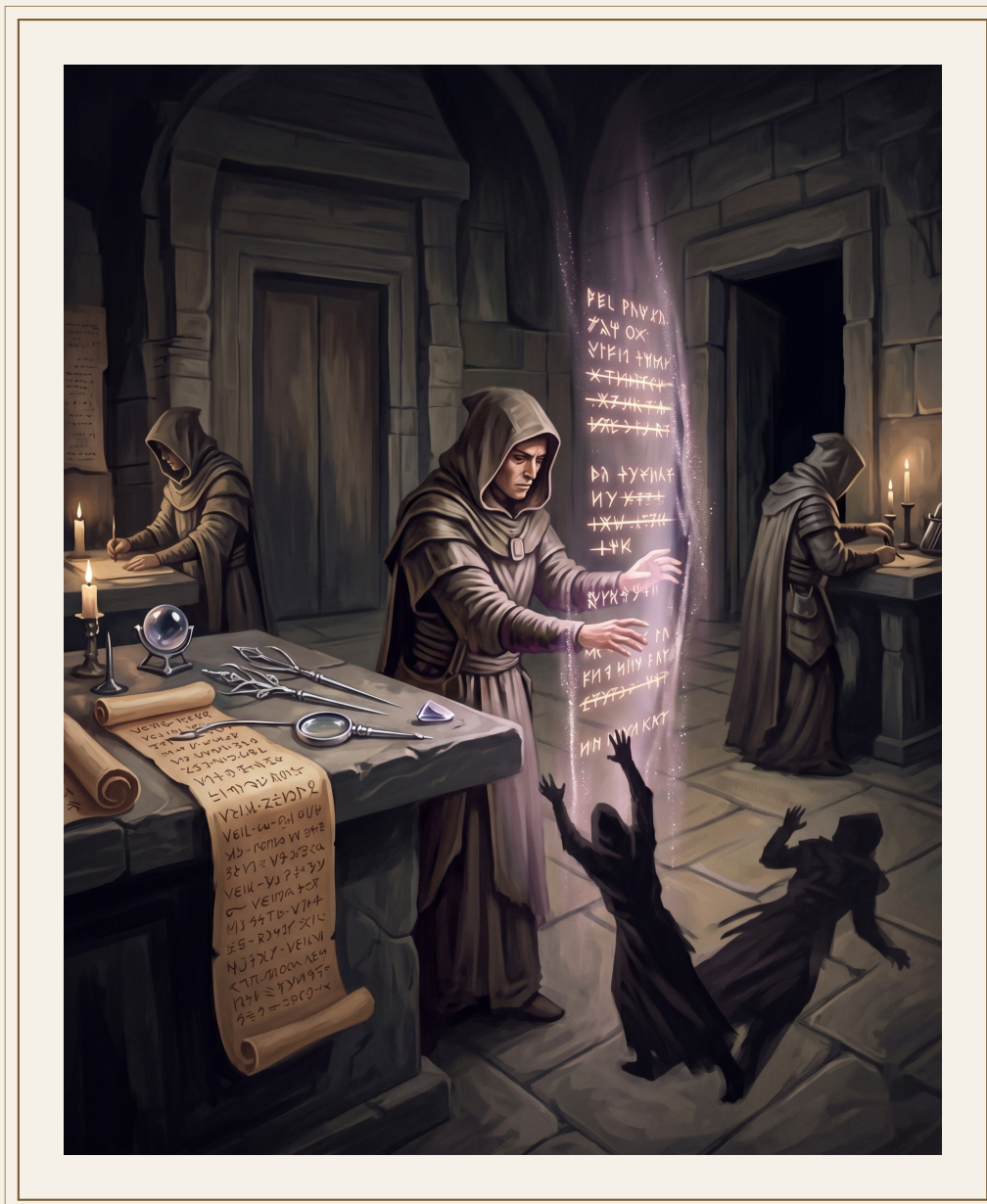
Los Laboratorios del Tejido.

dores aunque no compartan su visión de fondo. “Coser” y “sellar” se parecen más de lo que ninguno de los dos admite en público.