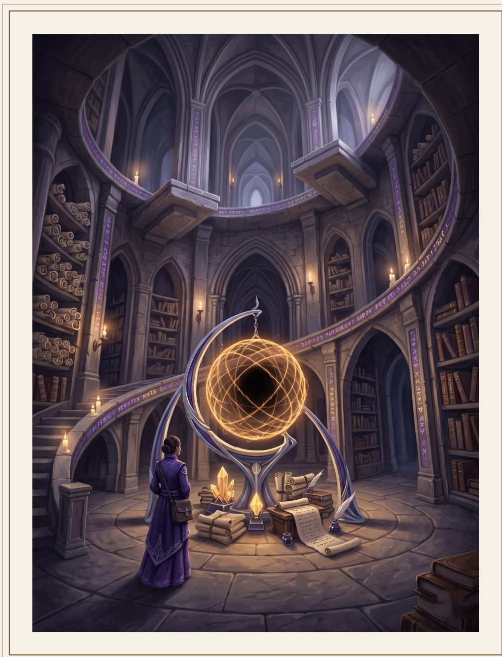
La Regla Vacía sellada.

Discutimos seis días. Cada Credo presento su caso. Cada caso tenía lógica. Cada lógica era incompatible con las otras dos. El Sello necesitaba que nadie tocara nada durante quince días. La Cosecha necesitaba cuarenta y ocho horas de acceso a los Umbrales. Nosotros necesitábamos intervenir antes de que el Sello cerrara los accesos.