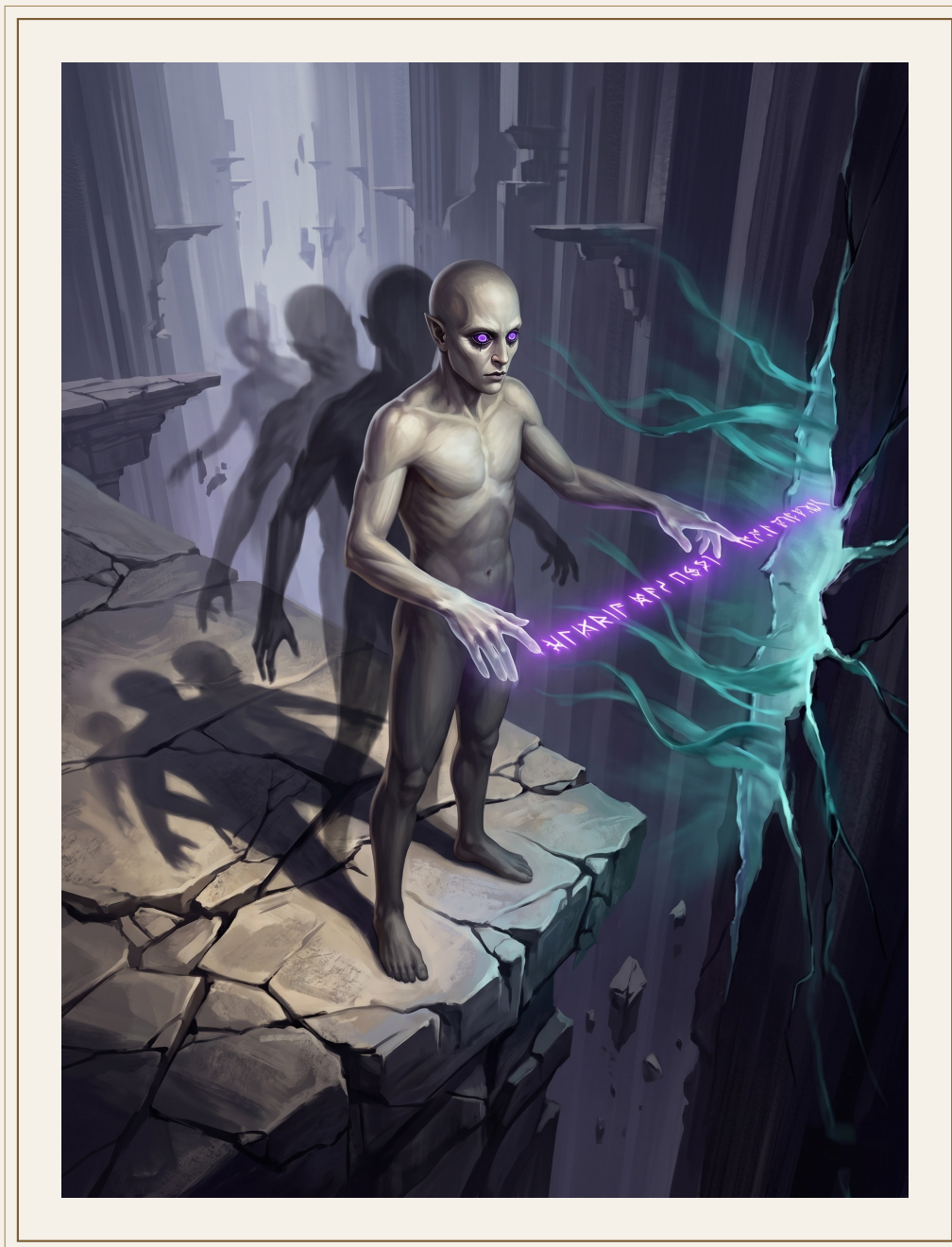
Un palimpsesto editando una grieta del Velo.

de proyección pasaron de colapso en ciento cincuenta años a estabilidad indefinida con mantenimiento periódico.