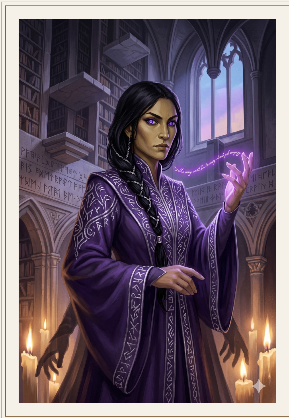
Nyx, tejedora del nuevo orden.

ha triplicado su capacidad de intervencion en el Velo.