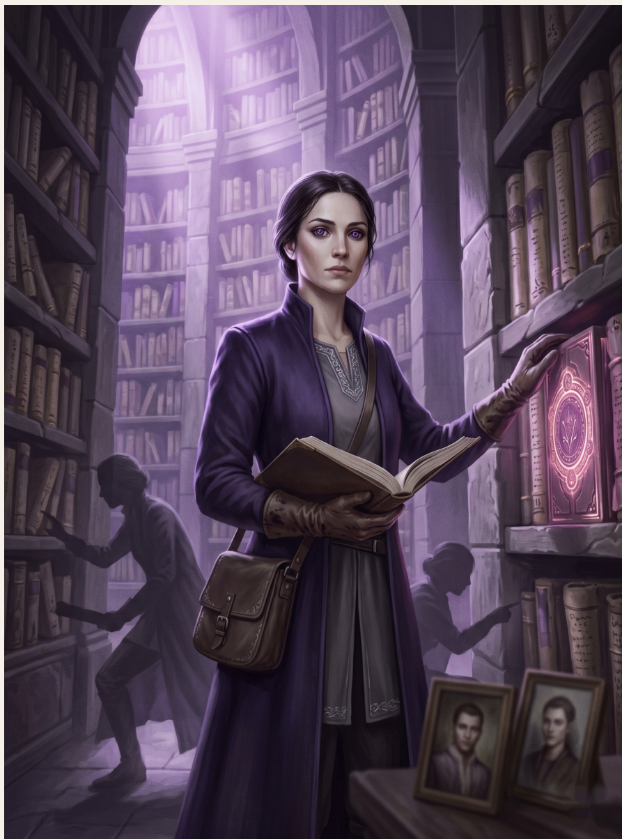
Issa, la investigadora fragmentada.

con el interior, al mismo tiempo. La maestra me dijo que dejara de hacerlo porque estaba “confundiendo el ejercicio”. Tenía ocho años.]